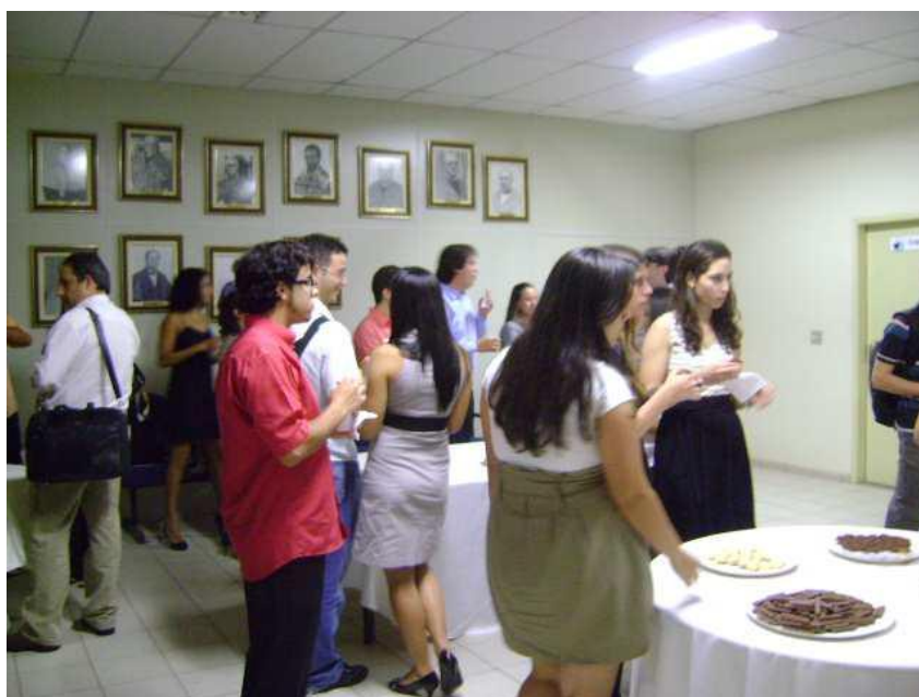
Evento LEGI: coffee break

As vantagens, sem dúvida, superam as desvantagens. Afinal, ganhar experiência, confiança, aprender a se portar em uma empresa, e ainda dentro da própria universidade, é muito vantajoso para um estudante de qualquer curso em que ele estiver.