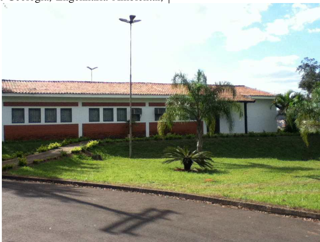
Foto: Parte lateral da nova sede

Por fim, com esta nova sala, haverá maior contato entre todas as empresas, dessa forma, espera-se uma troca maior de experiências profissionais.